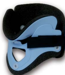
COL052 pediatric azzurro