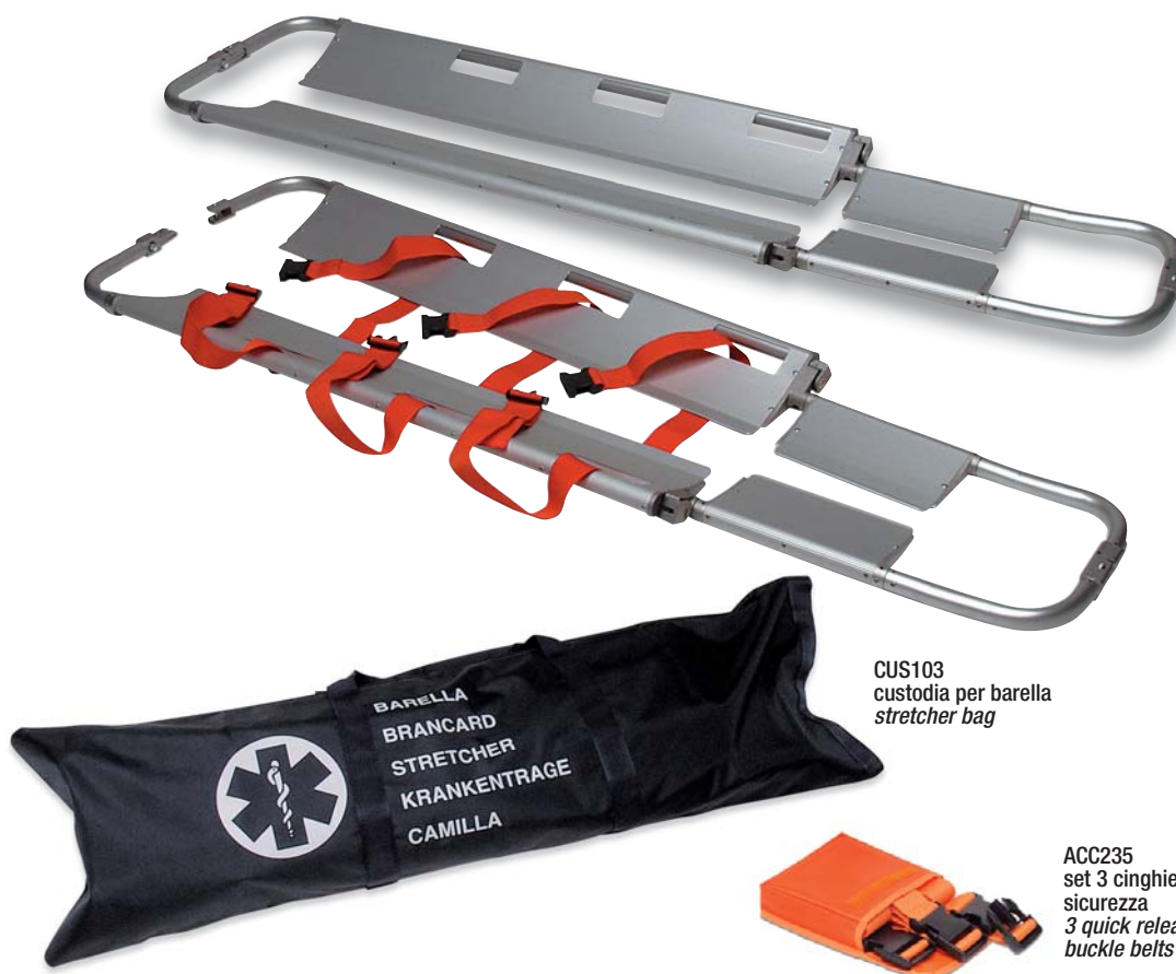
CUS103 custodia per barella stretcher bag