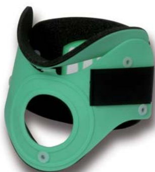
COL056 tall verde

COL051 COL052 COL053 COL054 COL055 COL056 COL057 CUS106