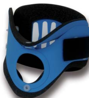
COL054 standard blu