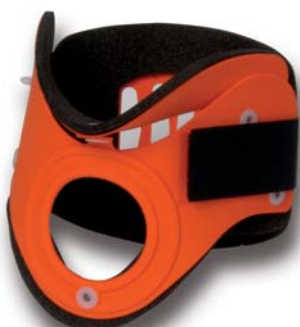
COL055 medium arancio