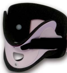
COL051 infant rosa