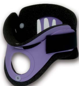
COL053 stout viola