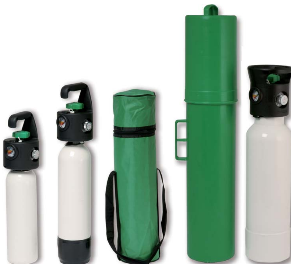
BOS267 - lt 2